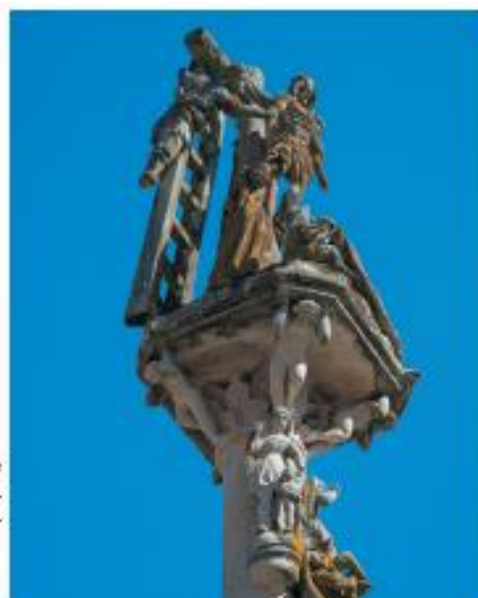
Cruz e parte superior do fuste.

(Publicado na Revista COUSAS DE. Edicións BASAN S.L. – VIGO. Verán 2022)