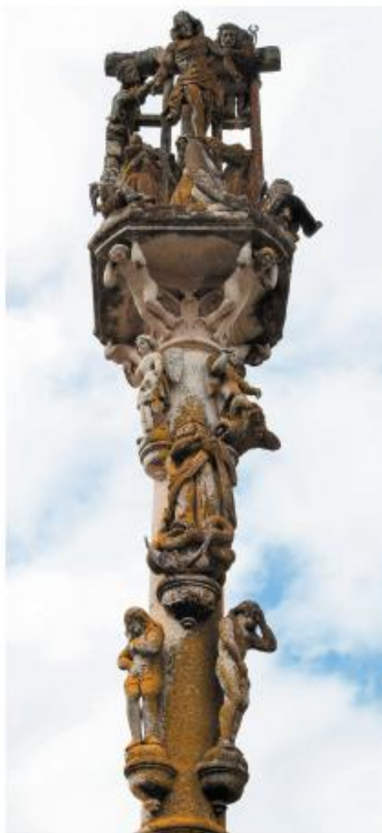
Turismo de Cangas.

Neste mesmo ano trasladouse a Madrid, baixo a protección do político de Ponteareas Sr. Bugallal, segundo testemuñas que poden