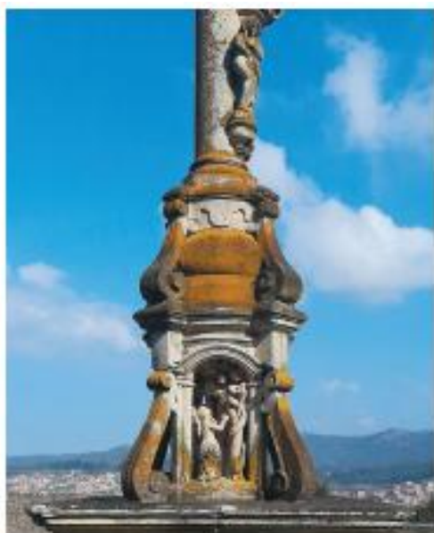
Basamento e parte inferior do fuste

• Cruz: No máis alto do cruceiro escenifícase o desencravo de Cristo. Esta é a parte máis importante do conxunto. Hai que destacar como foi baleirada aquela única roca de granito traída da zona de Liméns. Facendo unha descrición da escena, vemos que Xesús está sendo baixado da cruz por Xosé de Arimatea, propietario do sepulcro onde foi depositado o corpo de Cristo, e por Nicodemo. Abaixo San Xoán agárrao dos pés, mentres a Magdalena bótase as mans á cabeza ea Virxe María axeónllase mirando cara ás súas mans, que supomos, aguantaban a coroa de espiñas ou esperaba para recoller o corpo xacente do seu fillo.