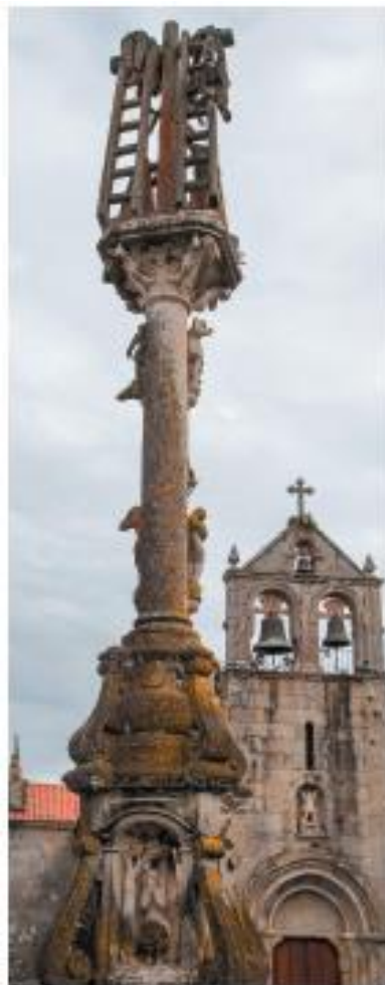
Turismo de Congas.

Dende 1864, D. Juan Manuel Míguez ocupouse de erguer os muros do adro, para cuxo fin aporta 480 reais. En 1868 a información do II Libro de Fábrica é concreta e aporta