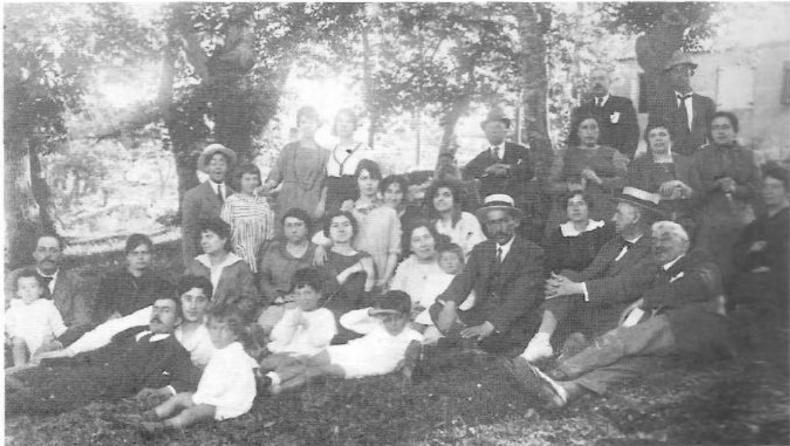
familia cabanelas en darbo. anos 20

Dende aquí o noso agradecemento a unha persoa de esta vila que chegou ata onde chegou a nivel internacional, e moita tristura porque as autoridades da época non lle fixesen o seu merecido homenaxe, que dun modo sinxelo quero facer eu dende aquí con admiración e afecto.