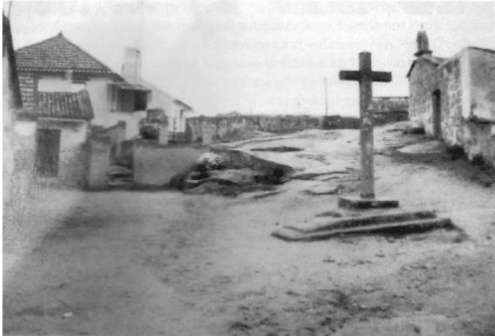
Foto antiga da capela de San Bartolomeu.