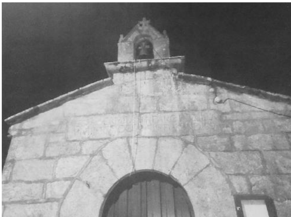
Fachada da ermida coa inscrición.