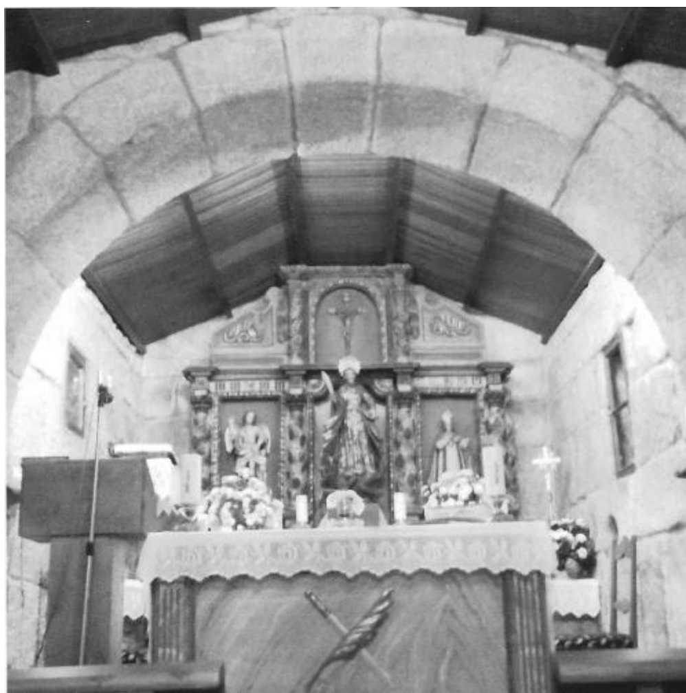
Interior da capela

“/ ... de componer y pintar El cristo y algunas imagenes que estaban maltratadas... todas las imagenes de la dha hermita que habían quebrantado y maltratado los moros el año pasado de seiscientos y diez y siete.../”.